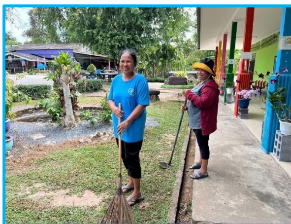
Mamans venues aider au grand nettoyage de l'école