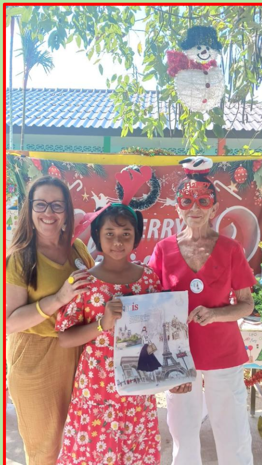
Cadeau de Noël tiré au sort