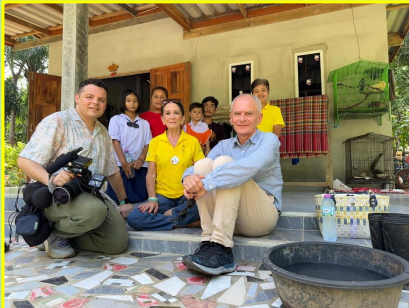
JOURNAL FRANCE 2 DEC 2024.mp4

Ces 2 jours de tournage se sont conclus par le parrainage afin que le journaliste puisse rencontrer les filleuls et par un moment émouvant filmé sur la plage du Passe-Temps, mon petit paradis que beaucoup d'entre vous ont découvert pendant la semaine du 20 e anniversaire. Une équipe de l'AFP et un correspondant local pour La Croix, RTL, et Ouest France sont venus également sans oublier les 2 journaux francophones dont vous retrouverez les liens