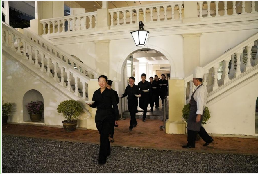
Le ballet des serveurs « à la française »